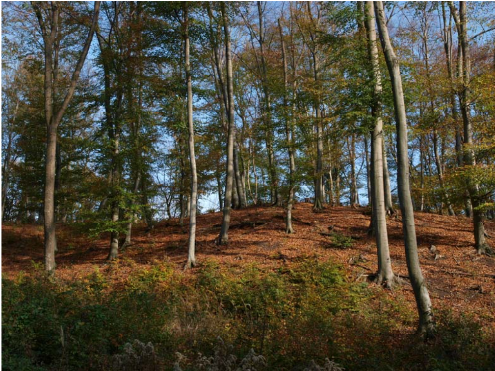
Bükkös, Keszthelyi-hg.