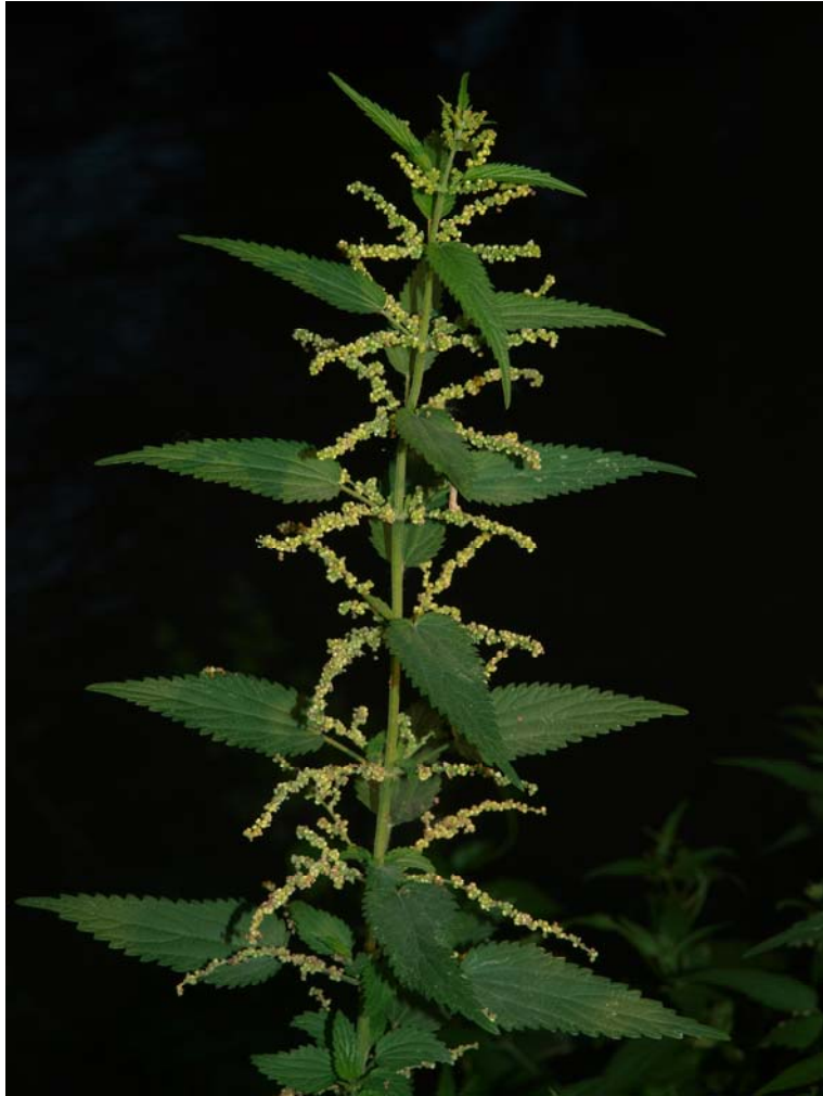
Nagy csalán