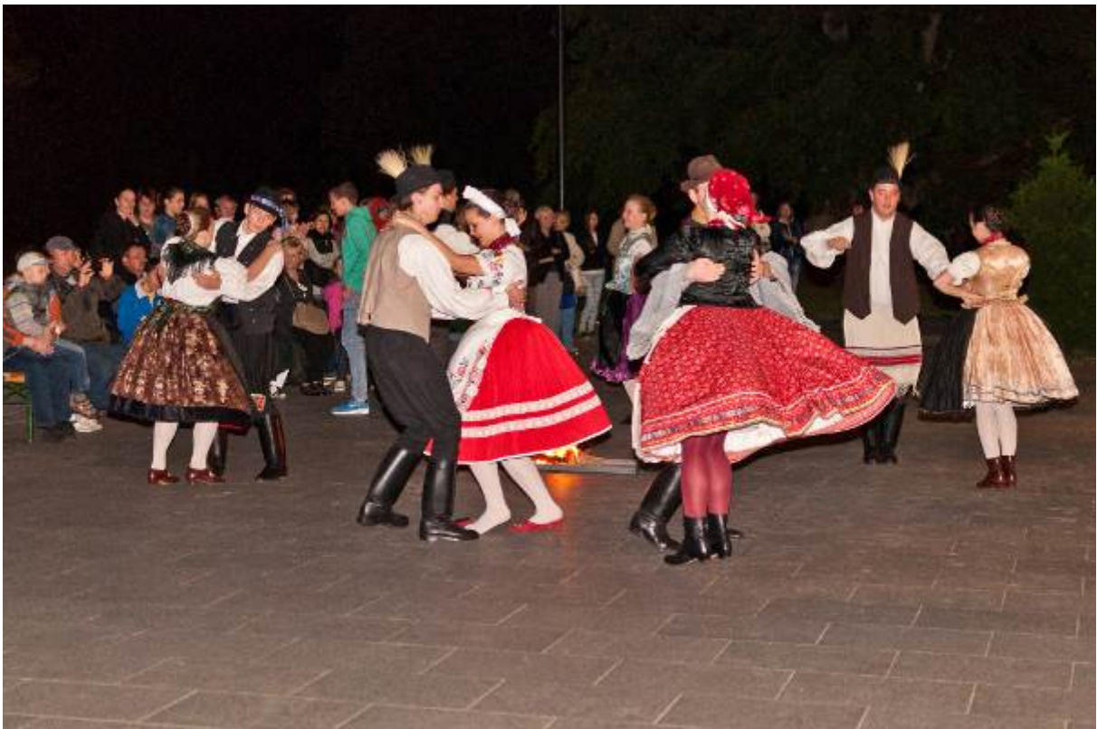
Vidróczki néptáncgyűttes műsora