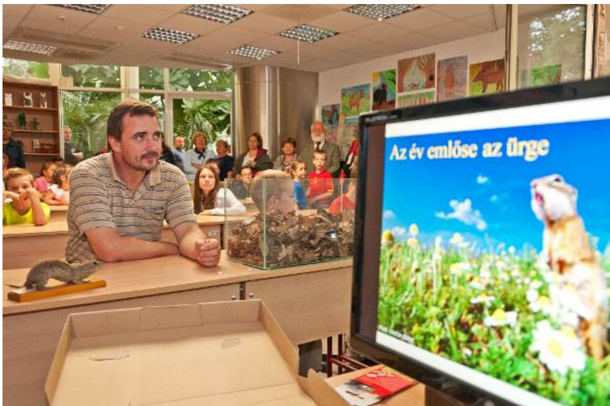
Ürge, az év emlőse –gyakorlati kisemlős bemutató