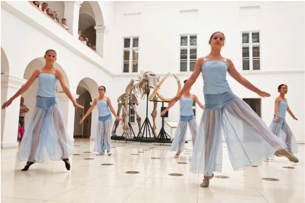
II. Rákóczi Ferenc Általános Iskola és AMI balett bemutatója