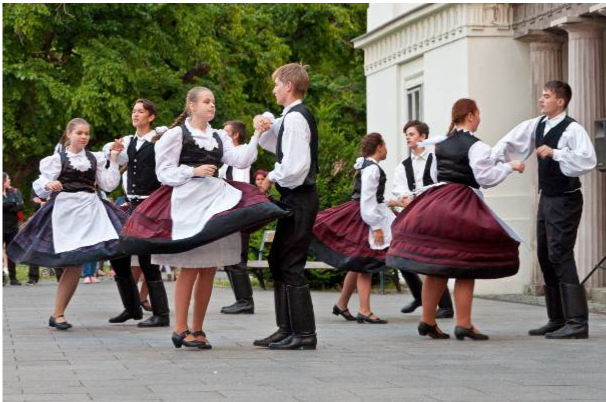
II. Rákóczi Ferenc Általános Iskola és AMI néptánc bemutatója